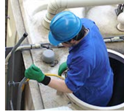
貯水槽・排水管清掃

ホームページ http://www.takara-group.co.jp/estate/